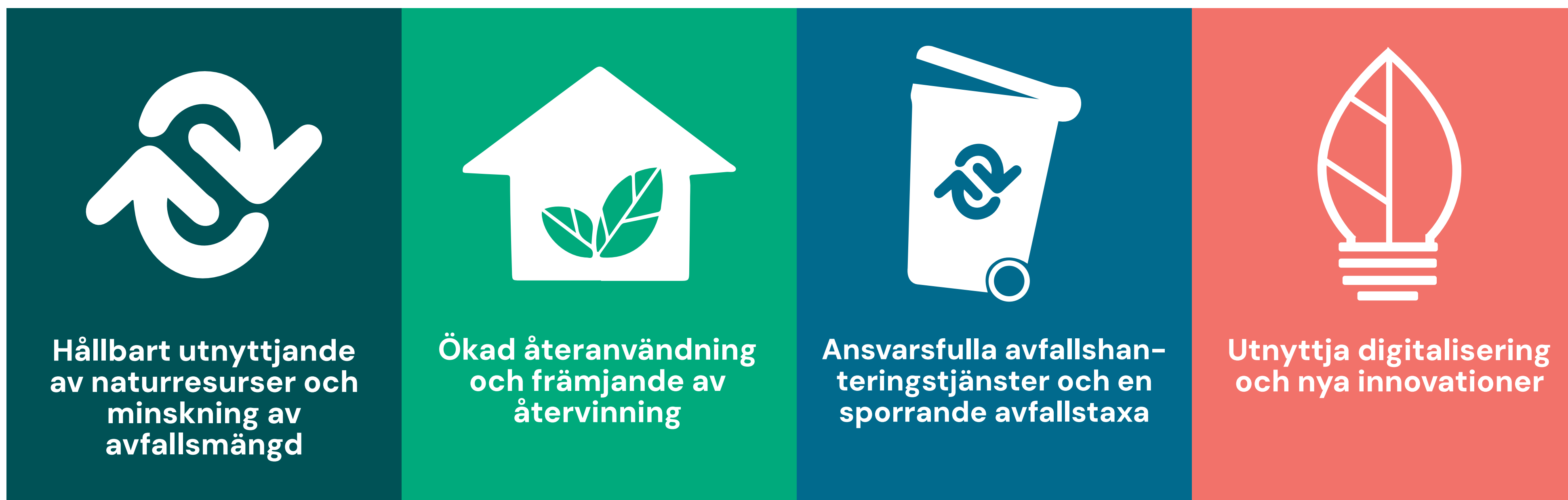
Bild 3. Vision och mål för det avfallspolitiska programmet.

Målen i det avfallspolitiska programmet för perioden 2025–2030 är följande: